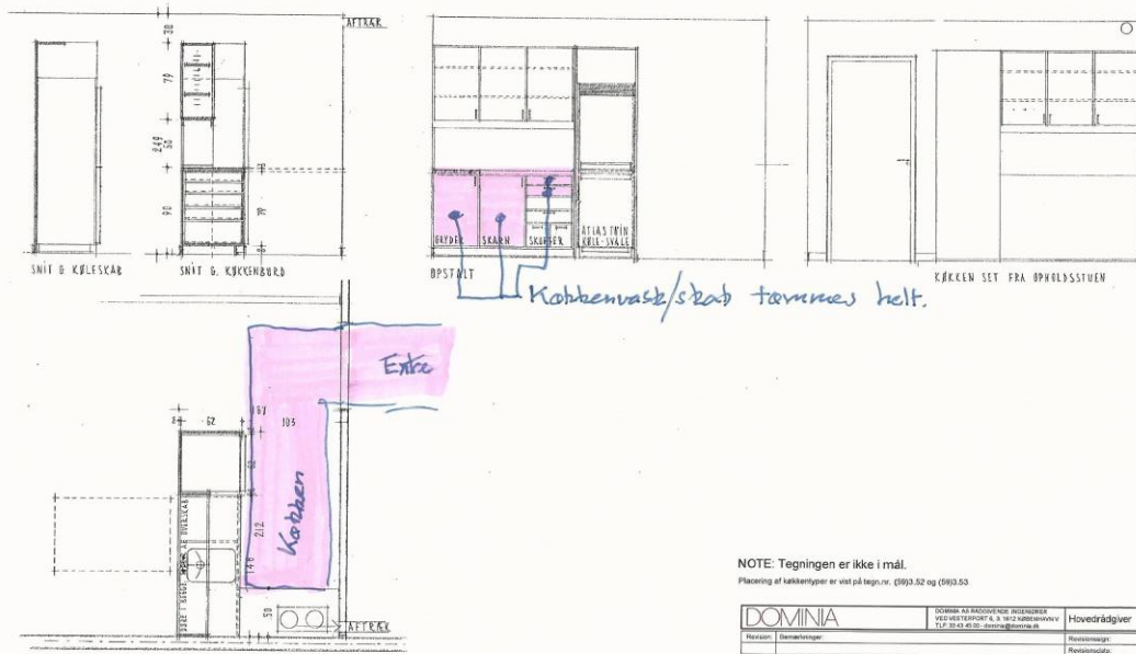
Køkken type 6 i blok C og D

NOTE: Tegningen er ikke i mål. Placering af køkkentyper er vist på tegnr.nr. (59)3.52 og (59)3.53