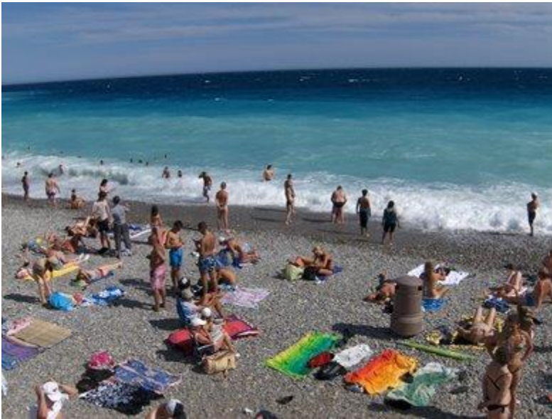
Stranden i Nice - tæt på byen

Et ophold ved Cote d'Azur kan også byde på masser af natur, kildevand fra bjergene og frisk luft.