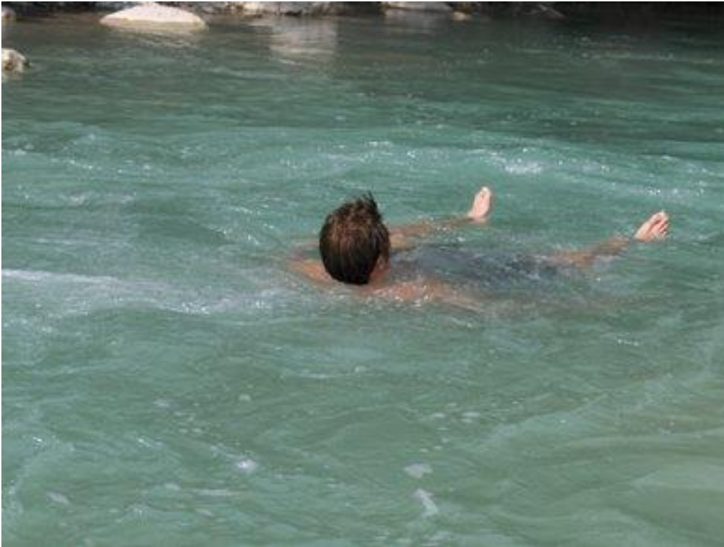
Drive med strømmen