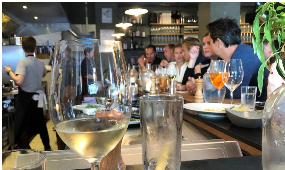
Restaurant Totto, Amagerbrogade