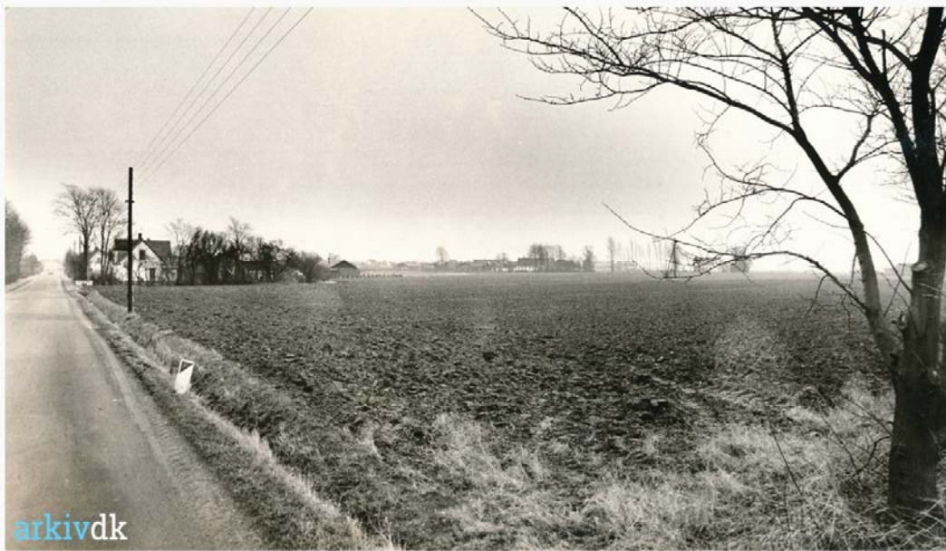
1 af 1 - Vesterbro set fra vest. I. hus på højre hånd er Norddal

Parcellen er beliggende på Vesterbro 35 hvor der ligger et mindre hus på 78m 2 opført 1900 2 . Da Thorvald køber er ejendommen "skyldsats under Matr.Nr.117b og 116i, Storeheddinge Købstads Markjorder for Hartkorn 1td 1skp 3fdk og 2 alb ", hvilket var ca ¼ af Møllekærgaards størrelse målt i hartkorn. Købssummen er sat til 37000 kr. 3