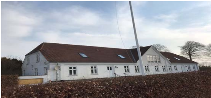
Stuehuset på Sønder Hestvang er opført i 1860.